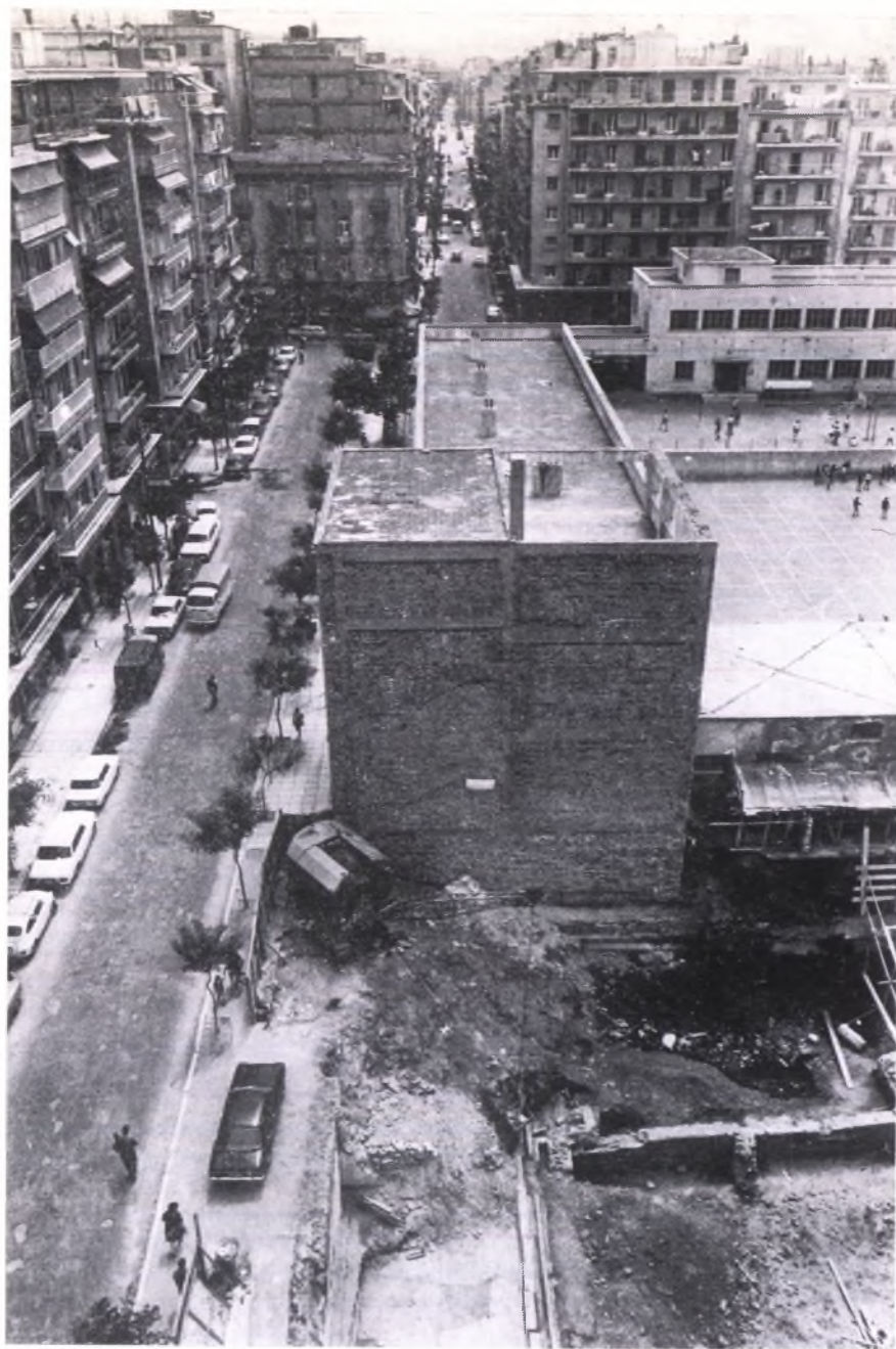
Fig. 3. Les rues Krystalli et Philippou et une partie de la rue romaine.