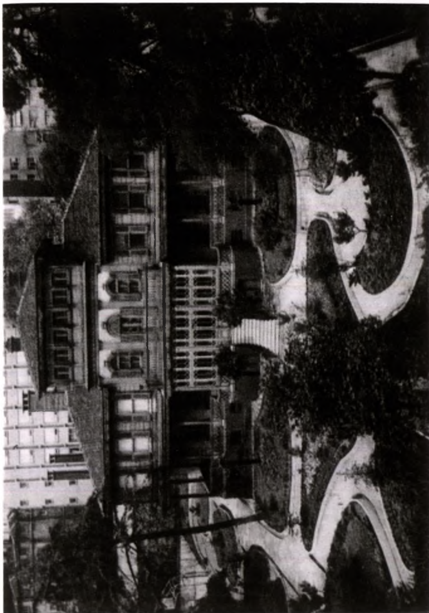
Εικ. 1. Το Μέγαρο της πρώην Εξουχίας στο Σινλί (P. Tuglaci, Bulgarian, Istanbul, ό.π., σ. 195).