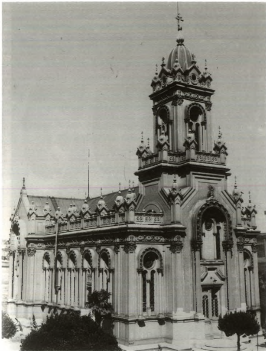
Εικ. 2. Ο Ναός του Αγίου Στεφάνου στο Φανάρι (Αρχείο Βουλγαρικής Παροικίας).