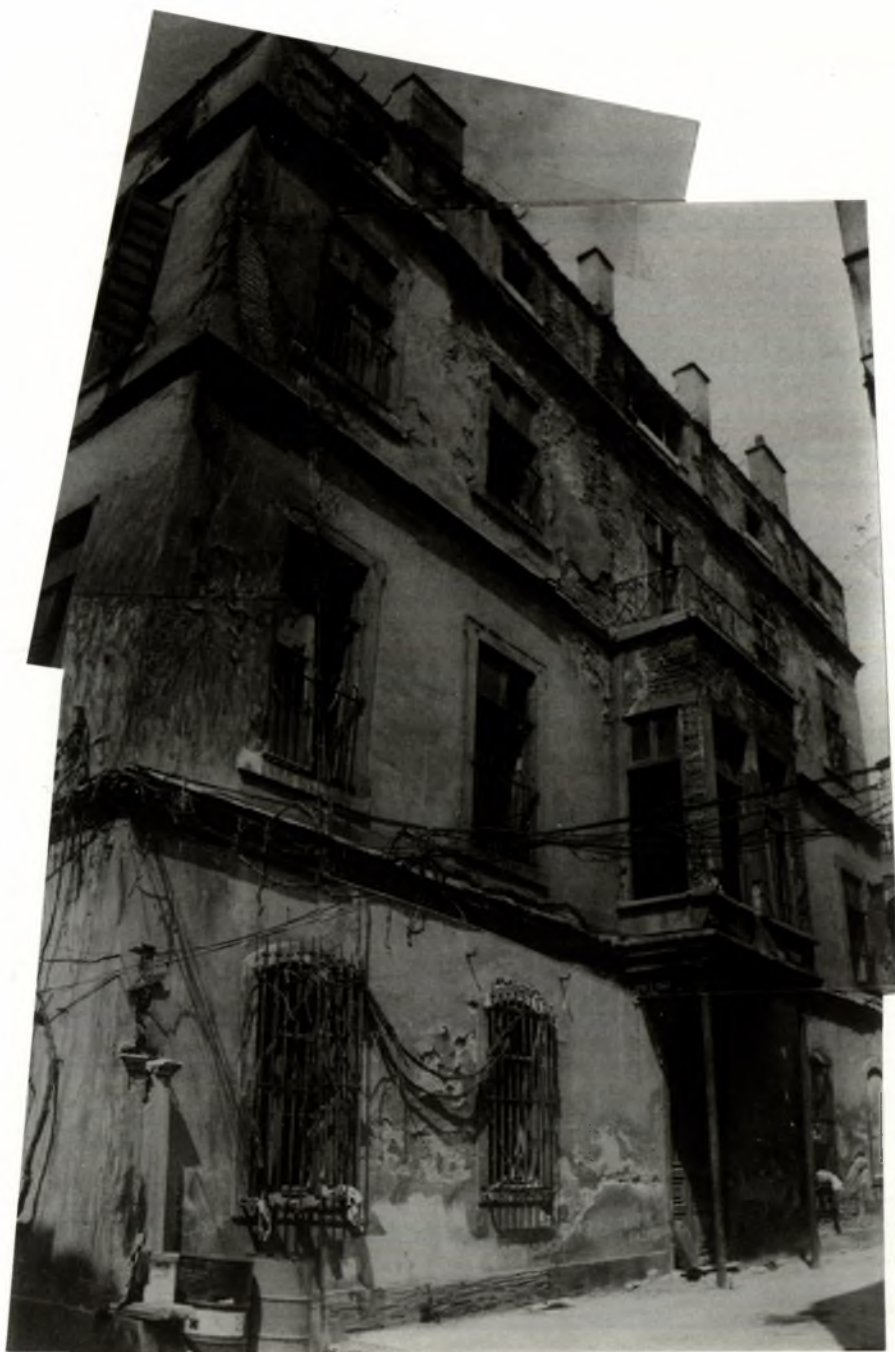
Εικ. 3. Το Βουλγαρικό Σχολείο Josif A' στο Πέραν (Φωτ.: Α.Κ.Ι., 1991).